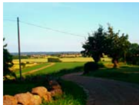
Utsikt från Steningeåsen ner mot Harplinge.