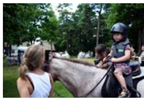
Ridning på Hembygdsgårdens dag i Harplinge.