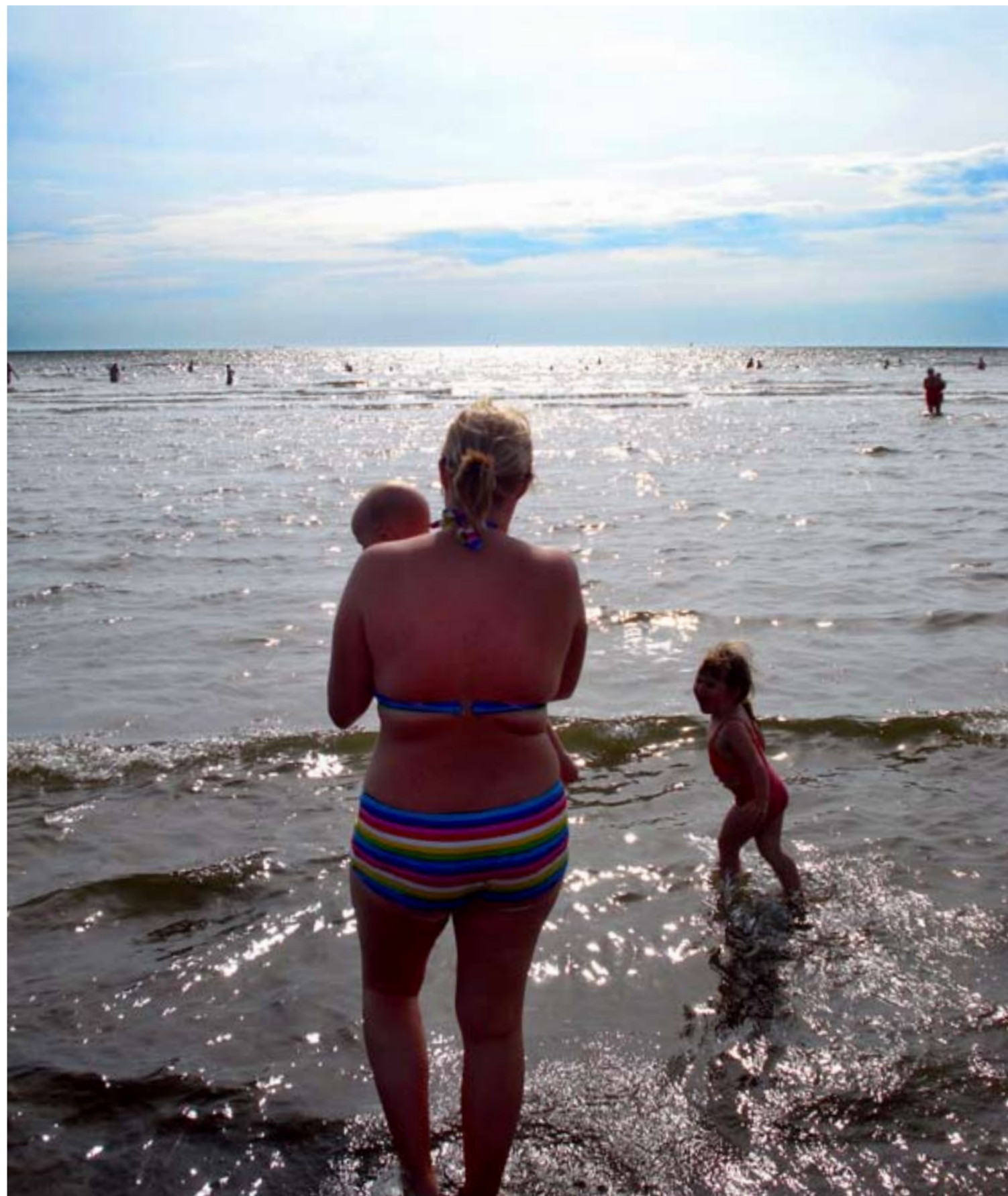
Långgrund och milt vatten på stranden i Ugglarp.