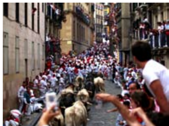
Tjuirusningen på San Fermin i Pamplona.