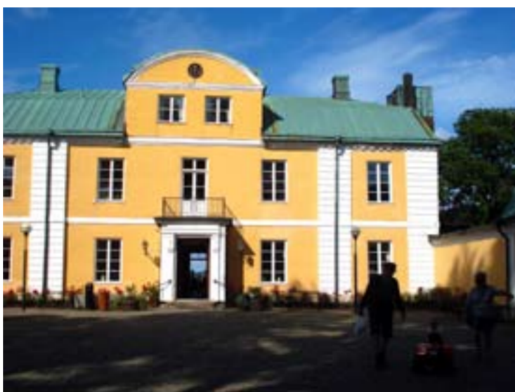
Wapnö slott med stiltigt slottsfika.

Slöinges stolthet Sia säljer gräddglass med aromer från hela världen till halva priset i fabriksbutiken. Smaker av lönnsirop och ägglikör smeker strupen en brännhet sommar dag då asfalten ångar. Äntligen dags för svalka vid Ugglarps långgrundstrand där vattnet snabbt värms upp som i en badbalja med mjuk sandbotten.