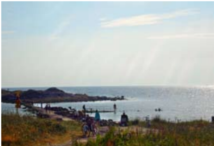
Kvällssol vid Steningebadet.

På Dränggård säljs ekologiska jordgubbar, lök och sallad – bara att själv lägga pengarna i en låda. Skepparp på Steningeåsen har en utsikt som utklippt ur en turistbroschyr från Provence, fast cypresser är utbytta mot ekar och guldgula havreodlingar utbreder sig i stället för lila lavendelfält.