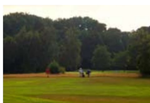
Haverdals populära golfbana nära havet.