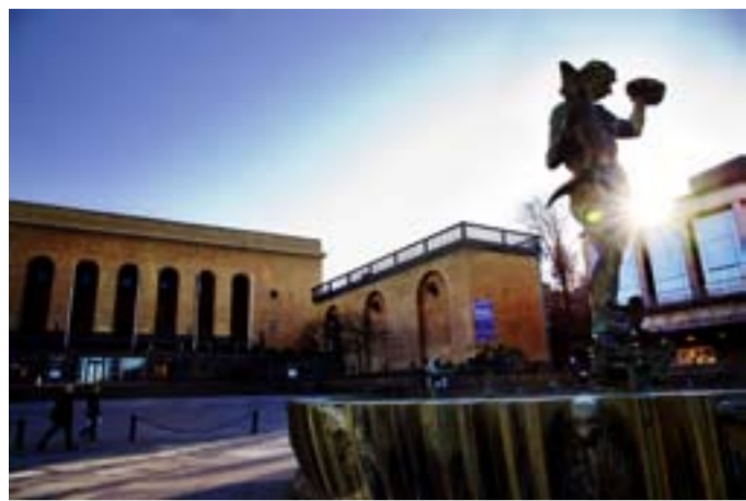
Göteborg är poppis på sommaren.