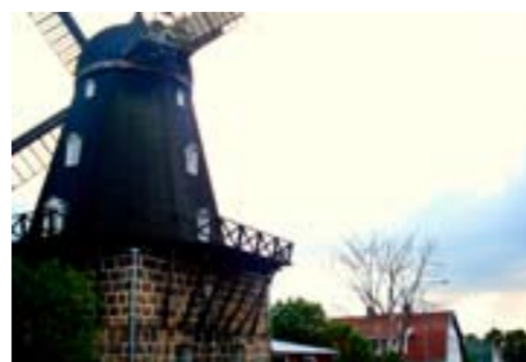
Den gamla kvarnen i Harplinge, byn som är omsjungen av Gyllene Tider.